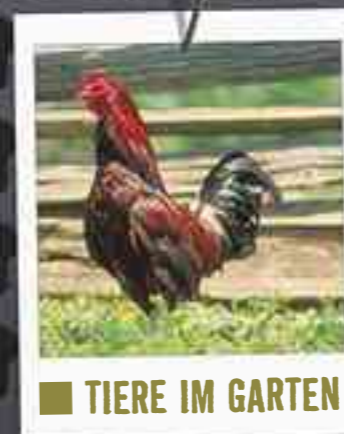
TIERE IM GARTEN

Und vieles mehr! Im Prinzip alles, was Du für Deinen haarigen, geschuppten oder gefiederten Freund brauchen könntest. Aber diese Broschüre ist nur ein kleiner Vorgeschmack. Die volle Auswahl findest Du in unserer Zoo- und Aquaristikabteilung.