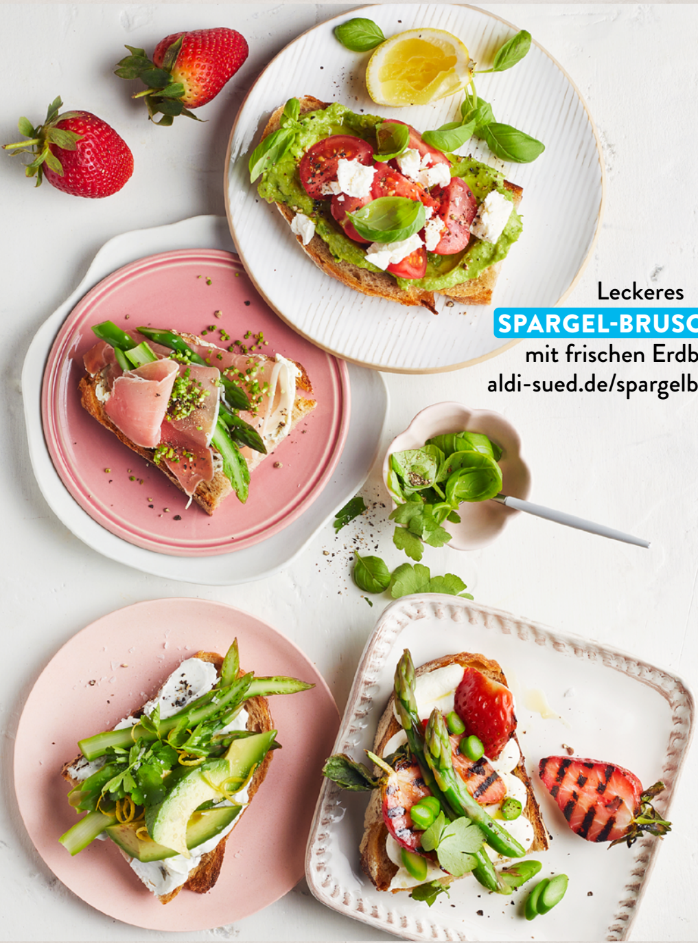
Leckerer SPARGEL-BRUSCHETTA mit frischen Erdbeeren aldi-sued.de/spargelbruschetta