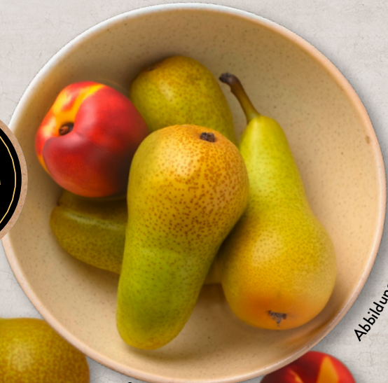
Abbildung mit Hilfe von KI generiert.