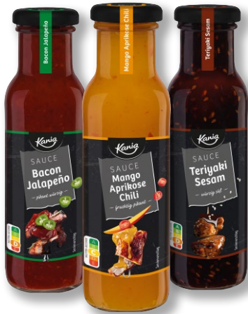
Kanja Grill-/Barbecuesauce Versch. Sorten. Je 230 ml