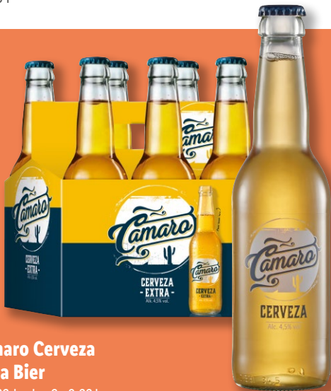
Camaro Cerveza Extra Bier Je 0,33 l oder 6x 0,33l