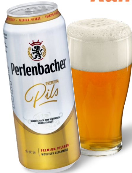
Perlenbacher Premium Pils Je 0,5l