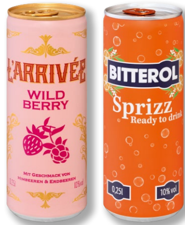
L'arrivée Wild Berry/Bitterol Sprizz 10 % vol Je 0,25l