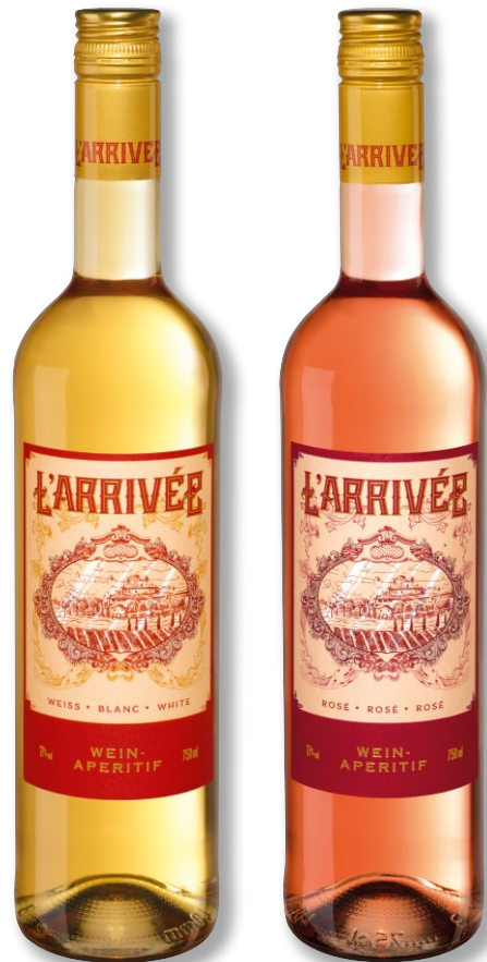
L'arrivée Weinaperitif 17 % vol Versch. Sorten. Je 0,75 l