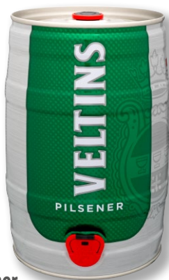
Veltins Pilsener 5-l-Bierfass mit Zapfhahn, pfandfrei Art.-Nr. 100365602 Je 5l

Mehr als 1500 Weine, Spirituosen & Bierfässer im Onlineshop