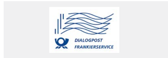
Muster Stempelabdruck DIALOGPOST

Mehr Infos erhalten Sie im Internet unter frankierservice.de