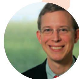
Dr. Thomas Ogilvie DHL Paket Deutschland

Wir haben uns bewusst entschieden, bei der technischen Umsetzung mit der infoMantis GmbH auf einen Spezialisten und auf ein bewährtes Produkt zu setzen. Die bewährten Software-Lösungen von infoMantis kombiniert mit deren Erfahrung und Expertise waren sicherlich wesentliche Schlüssel, ein so komplexes Projekt mit zahlreichen technischen und organisatorischen Schnittstellen auch in so kurzer Zeit umzusetzen. infoMantis ist es als Experten für intelligente Desktop-Widgets gelungen, mit dem DHL Versandhelfer ein Tool zu schaffen, das im Logistikbereich seines gleichen sucht. Die DHL untermauert mit dieser RSS-basierten Anwendung ihre hohen Ansprüche an individuellen Service und Komfort: Einfach, Immer, Überall!