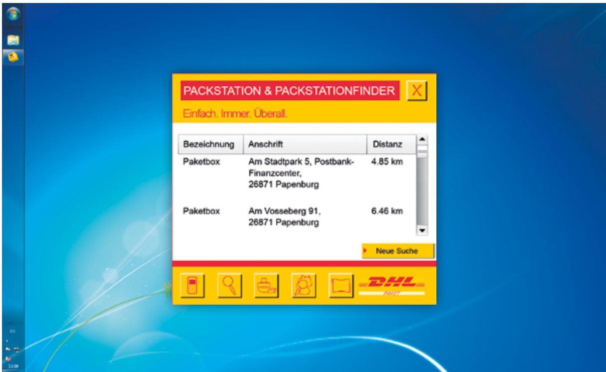
Der Packstationfinder zeigt nicht nur den Ort an, sondern auch die Distanz zum eigenen Standort.