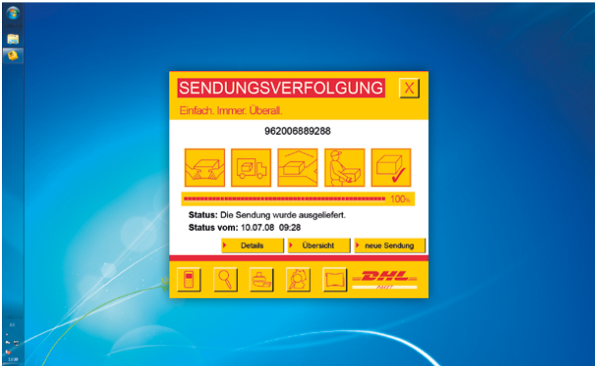
Mit der Sendungsverfolgung immer auf dem neusten Stand.